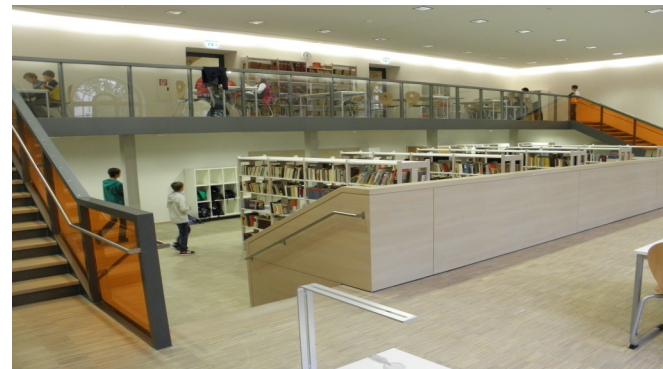
Schulbibliothek und Dokumentations- und Informationszentrum

AbiBac steht für Abitur und Baccalauréat, also das deutsch-französische Doppelabitur, das einen internationalen Bildungsabschluss darstellt.